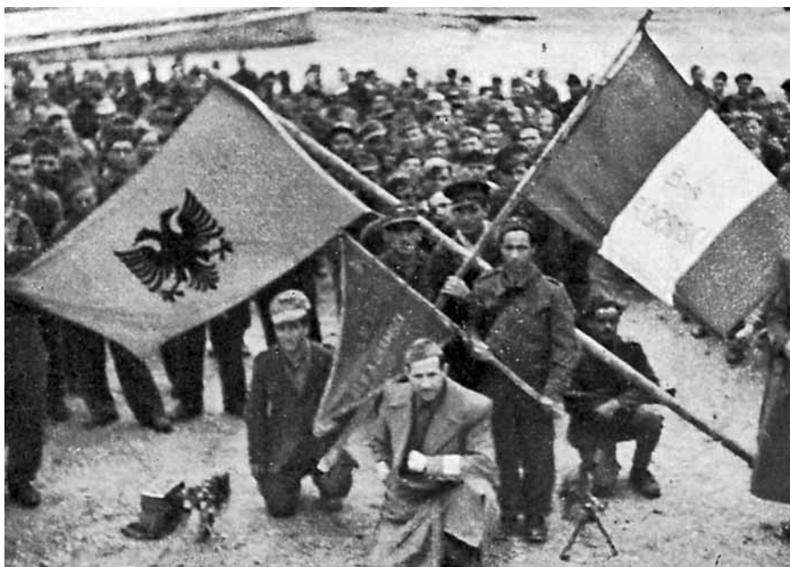
■ Fraternità d'armi italo-albanese tra la "Gramsci" e reparti dell'ENLA.

L'isola, occupata dalle forze dell'Asse nel 1942, è stato l'unico paese in cui, dopo l'8 settembre, le divisioni italiane "Cremona" e "Friuli", insieme alle loro unità di supporto, hanno combattuto secondo i metodi di guerra conven-