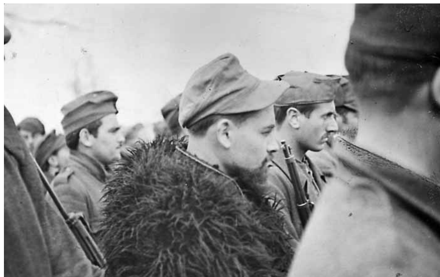
■ Partigiani della "Gramsci" in Albania.

Il Comando supremo italiano dette ordine alle divisioni dell'Armata di raggiungere la costa; ma ormai era troppo tardi. Il morale era basso. Le unità tedesche erano già penetrate profondamente nel territorio, fino al porto di Durazzo, ove si verificarono aspri combattimenti; le comunicazioni telefoniche con i vari comandi erano state nel frattempo interrotte. A quel punto, il giorno 10, il generale Rosi dette l'ordine di consegnare le armi pesanti ai tedeschi, con la illusoria speranza del rimpatrio. Solo la divisione "Firenze" non credette a quella promessa e si salvò quasi per intero, sfuggendo sulle montagne, al seguito del suo comandante, il generale Azzi. In quei frangenti tumultuosi, anche la divisione "Perugia" merita una particolare menzione per i sacrifici sopportati ed i molti combattimenti intrapresi lungo la via verso