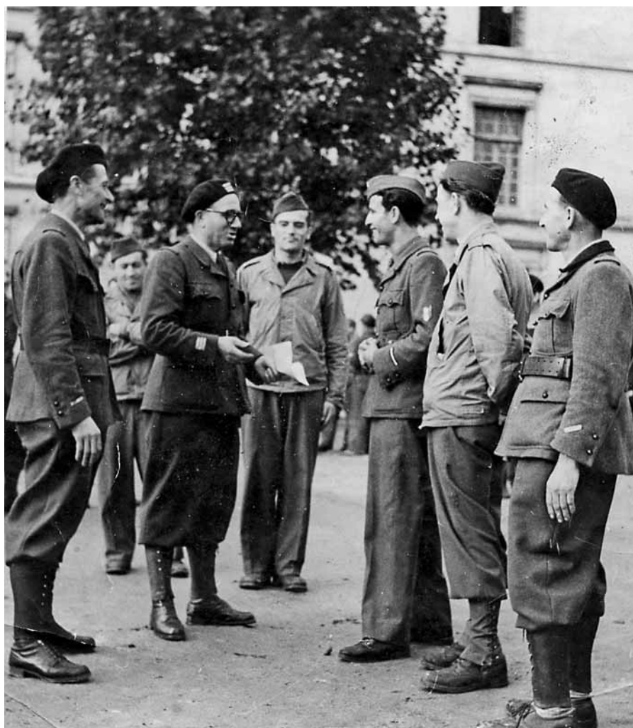
■ Francesi e italiani alla liberazione di Parigi nel 1944.

Così, l'8 settembre, giunse la resa dei conti. L'11 a Armata, cosiddetta "dell'amore", crollò di schianto. C'è però da rilevare che troppo improvviso fu l'armistizio, che lo stesso comandante dell'Armata conobbe solo il giorno dell'an-