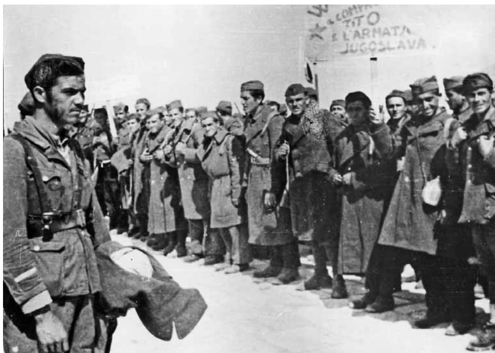
■ Il Battaglione "Garibaldi" in Istria nel 1943.

In particolare, le vicende della divisione hanno dell'inverosimile, se non fossero le testimonianze dei reduci a dichiararne l'autenticità: dalle prime salve di artiglieria del gruppo alpino "Aosta", comandato dal maggiore Ravnich, contro le avanguardie tedesche che voleva-