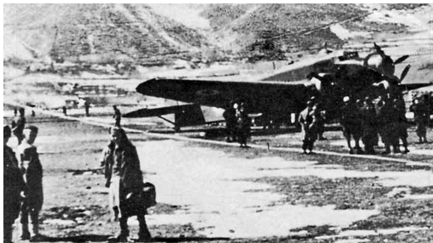
■ Nell'improvvisato campo d'aviazione dei partigiani in Jugoslavia è atterrato un aereo italiano.

L'attività di guerra del Raggruppamento Caccia si concretizzò in azioni di scorta, ricognizione, mitragliamento e bombardamento,