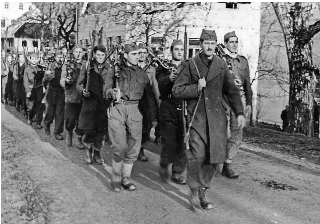
■ La brigata italiana "Fontanot" appena formata in Slovenia si dirige verso le posizioni.

Le motivazioni ideali che spinsero quelle unità alla Resistenza all'estero furono principalmente: il rifiuto di cedere le armi, malgrado gli ordini superiori, la fedeltà al giuramento prestato, lo sconcerto e la rabbia per essere state abbandonate dai loro più elevati comandanti, anche se, alcuni di essi, fino a livello di divisione, scelsero di rimanere, sino all'ultimo, vicini ai loro soldati e di dividerne le sorti, pagando con la vita. I morti in combattimento, di stenti e per il micidiale tifo petecchiale, che distrusse intere brigate italiane, furono oltre diecimila.