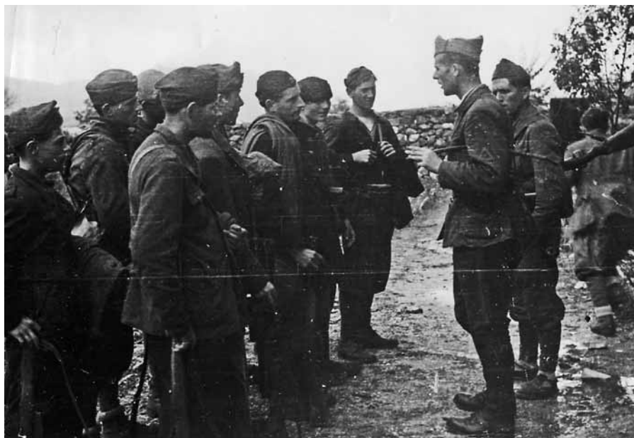
■ Soldati italiani in Jugoslavia mentre vanno ad arruolarsi con i partigiani.

stosa riunione, Badoglio viene indotto a leggerne via radio il testo, prima della sua fuga da Roma. Peraltro, la frase con cui si dispone che “le forze italiane reagiranno ad eventuali attacchi da qualsiasi provenienza”, è ambigua e tale da suscitare in tutti i comandanti di unità le più svariate interpretazioni e congetture.