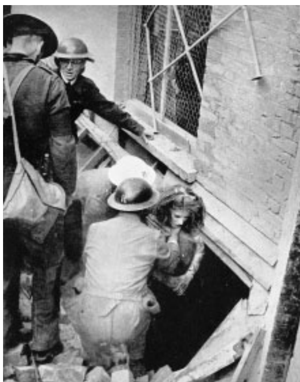
8. In un quartiere centrale di Londra, una donna ferita non in grado di muoversi, viene estratta ancora viva da sotto le macerie.