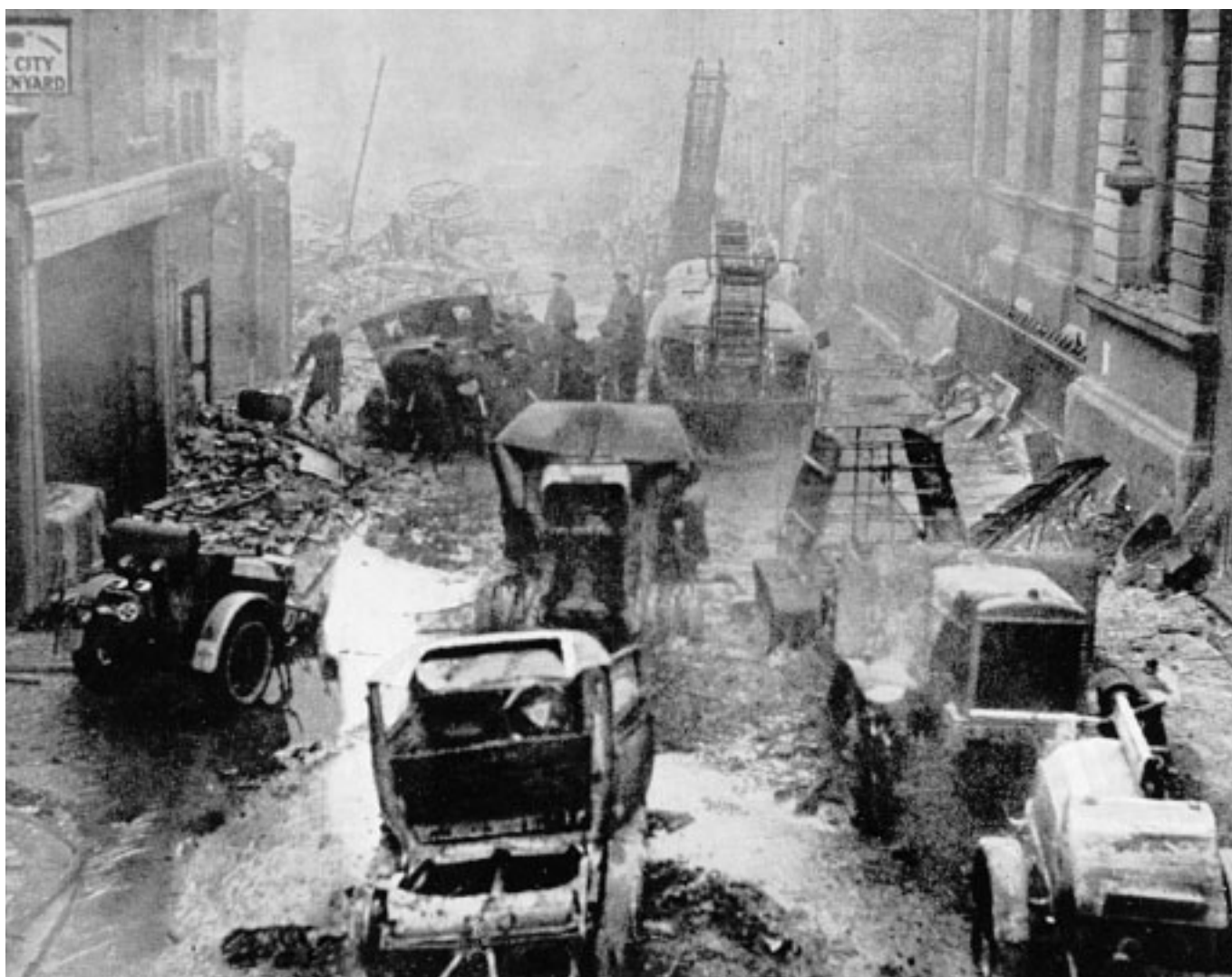
4. Una strada centrale di Londra dopo un bombardamento notturno.