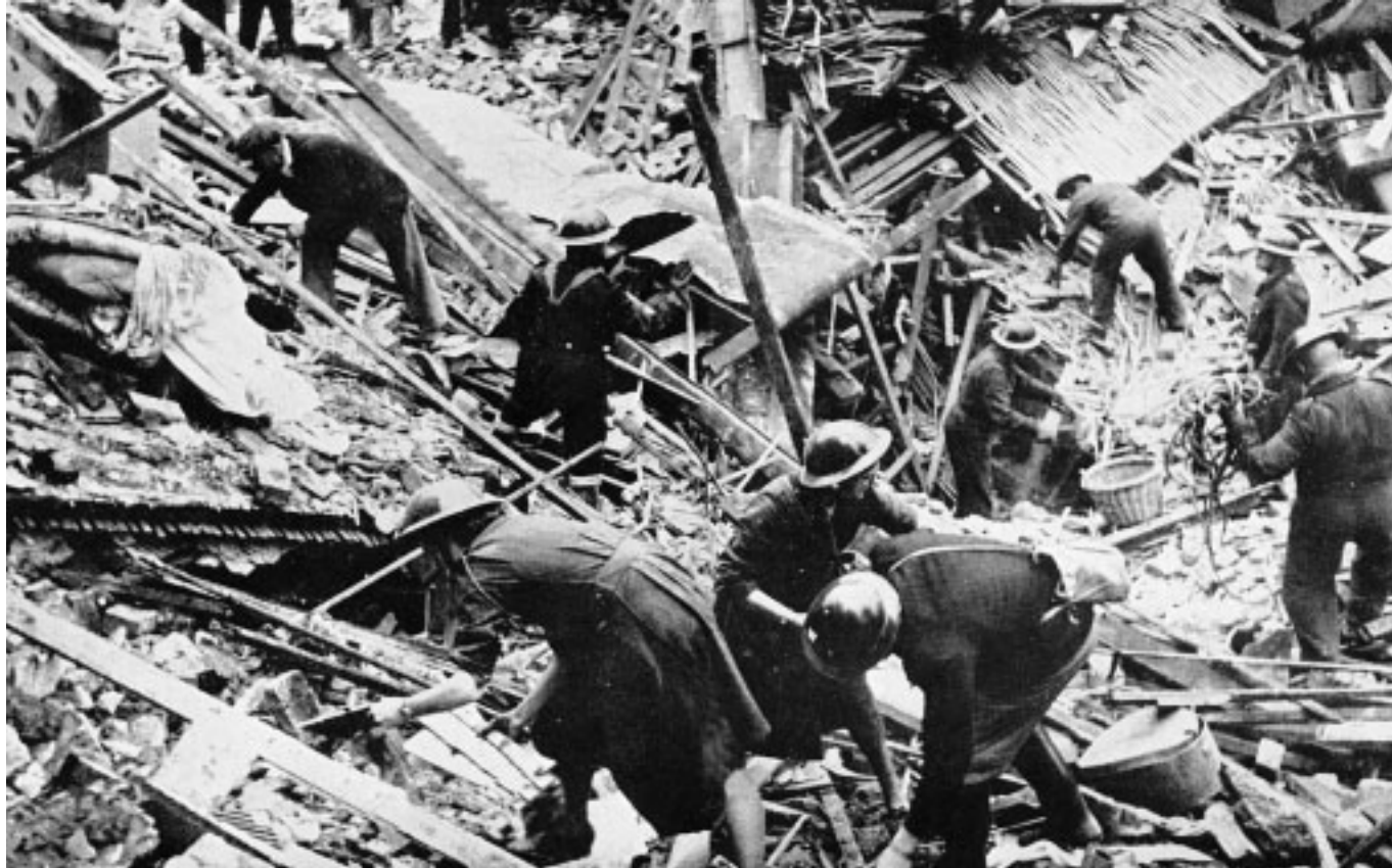
7. Dopo un'intera nottata di bombardamenti, uomini e donne della protezione civile cercano tra le macerie tutto quello che è recuperabile e scavano per portare alla luce i corpi dei deceduti e dei sopravvissuti.