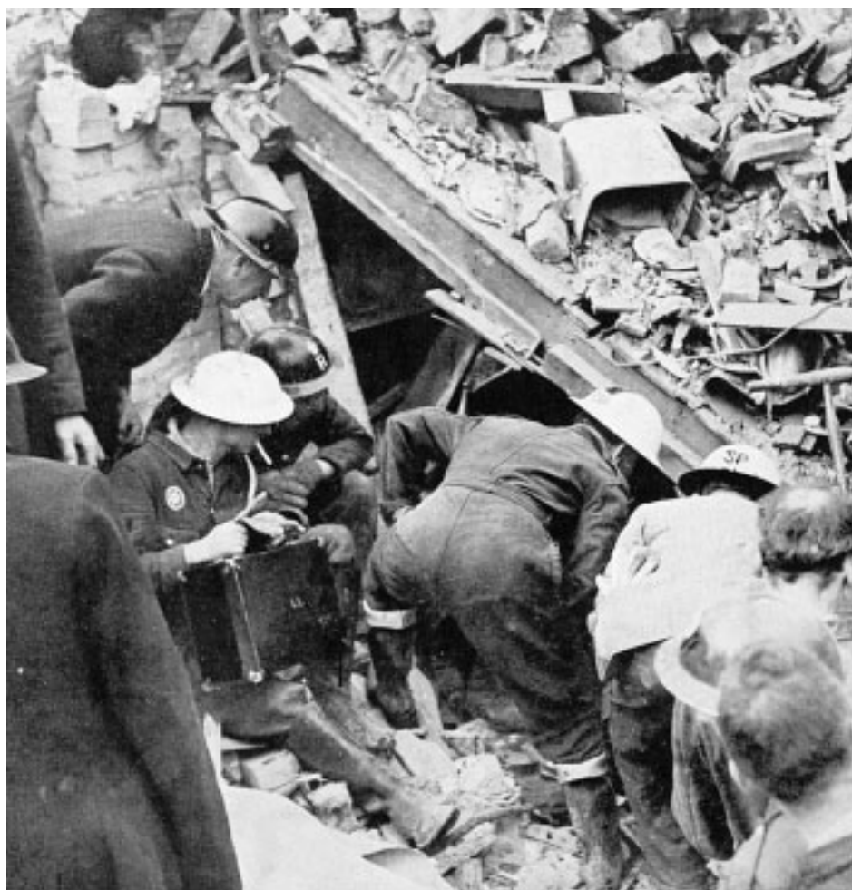
6. Dalle macerie di questa casa, si cerca di portare in salvo una vecchia signora rimasta prigioniera sotto una scala.