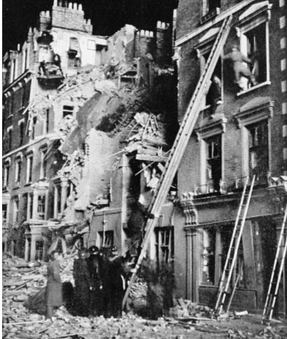
5. Nella notte, soldati, uomini della protezione civile e pompieri, mettono in salvo alcune persone rimaste intrappolate in casa. Siamo in St. Leonard Street.