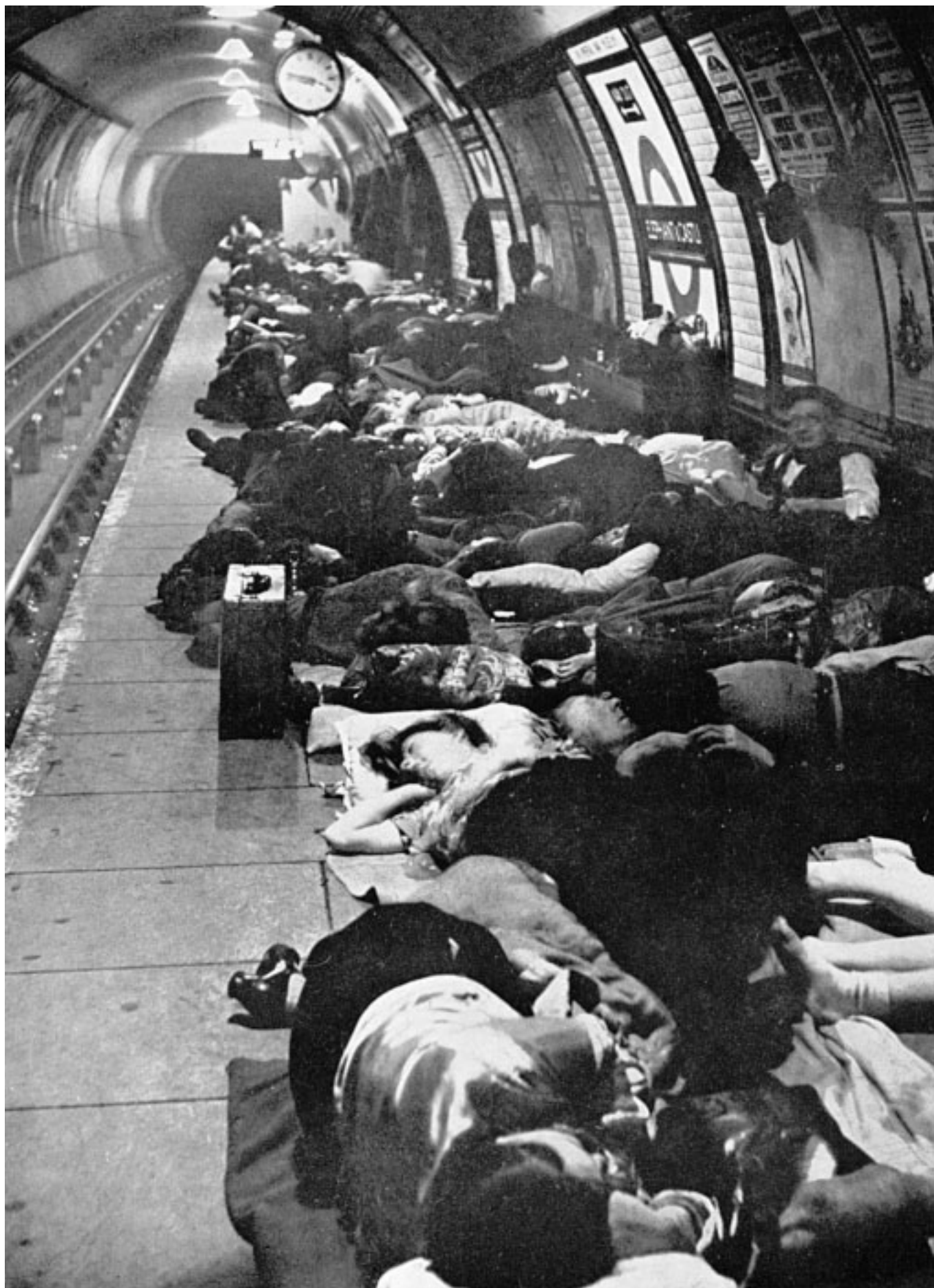
2. 11 novembre 1940: nella stazione della metropolitana di Elephant and Castle centinaia di persone, nel corso di un allarme aereo, hanno trovato un primo rifugio. Poi hanno deciso di trascorrervi tutta la notte.