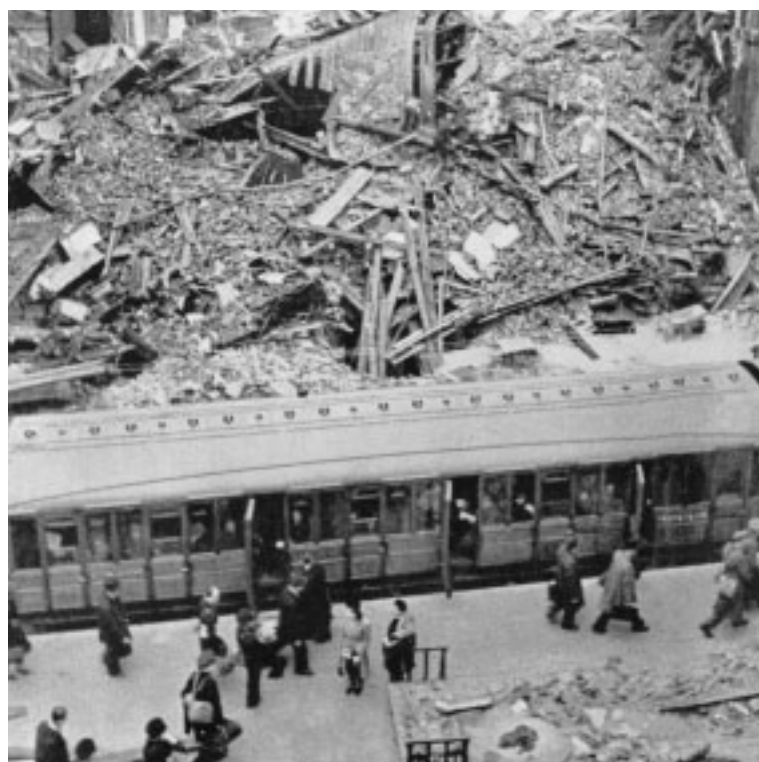
9. Alla stazione centrale di Londra, quasi completamente distrutta, i treni continuano a funzionare.