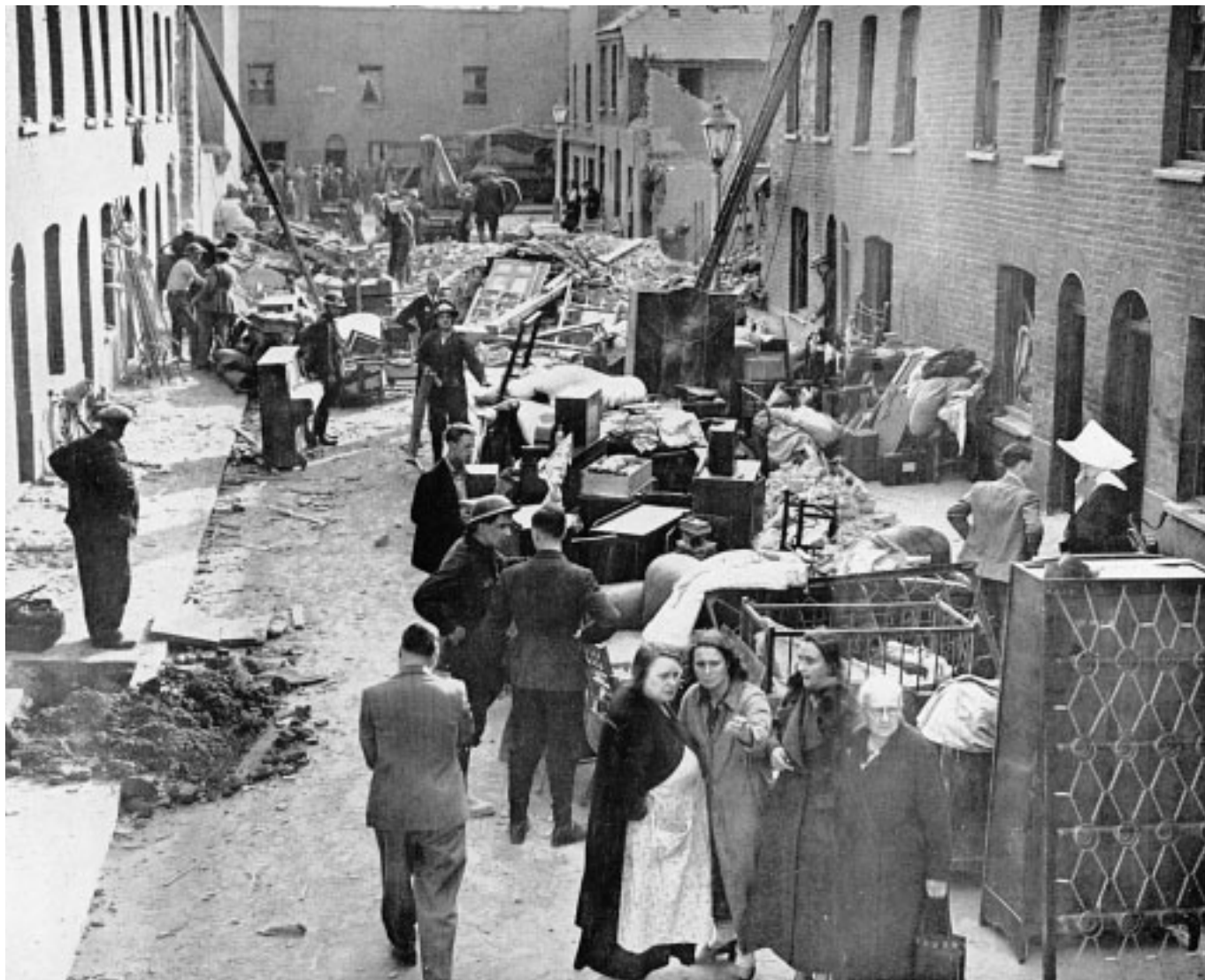
13. I senza tetto, dopo un bombardamento, cercano una qualche sistemazione presso i vicini, le caserme, gli istituti religiosi, le stazioni della metropolitana. Durante i bombardamenti, le poste, le ferrovie, la distribuzione del latte e dei viveri continuarono senza interruzioni.