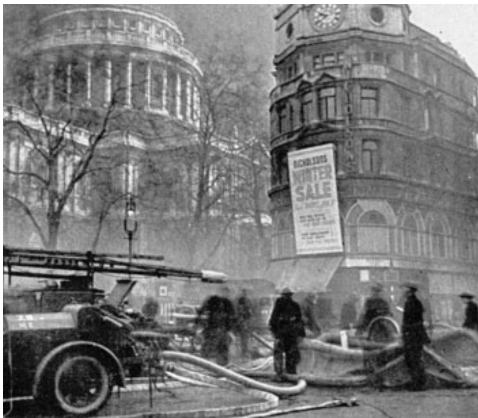
3. In mezzo ad un mare di fiamme, la notte dell'11 gennaio 1941, i vigili del fuoco al lavoro.