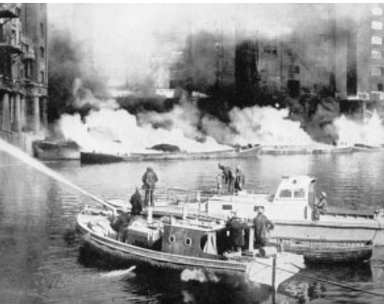
11. Pompieri impegnati a sedare un incendio nel porto di Londra.