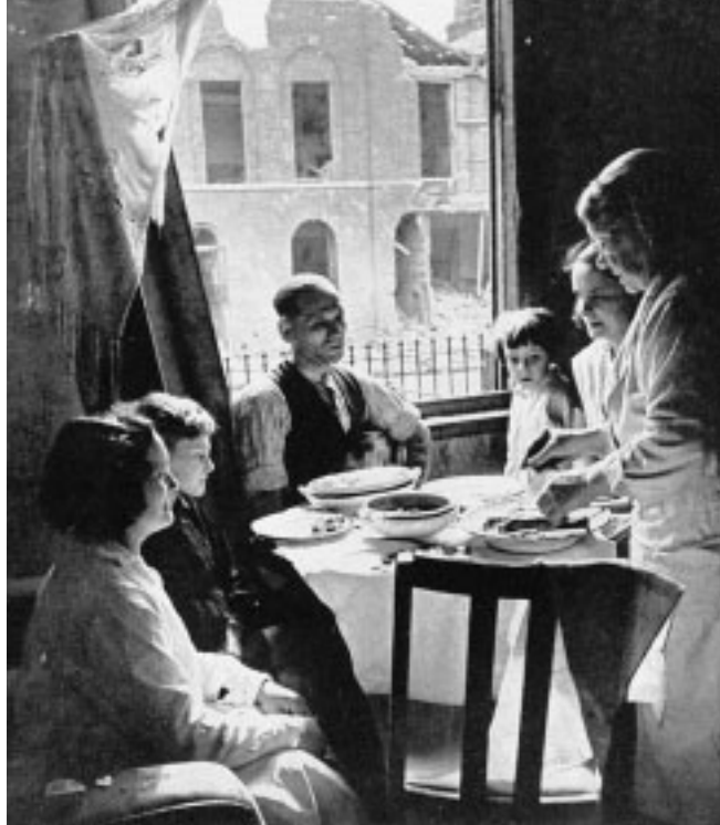
12. Una famiglia inglese ha deciso di prepararsi qualcosa da mangiare, in mezzo alle macerie. Siamo in uno dei quartieri dell'Est.