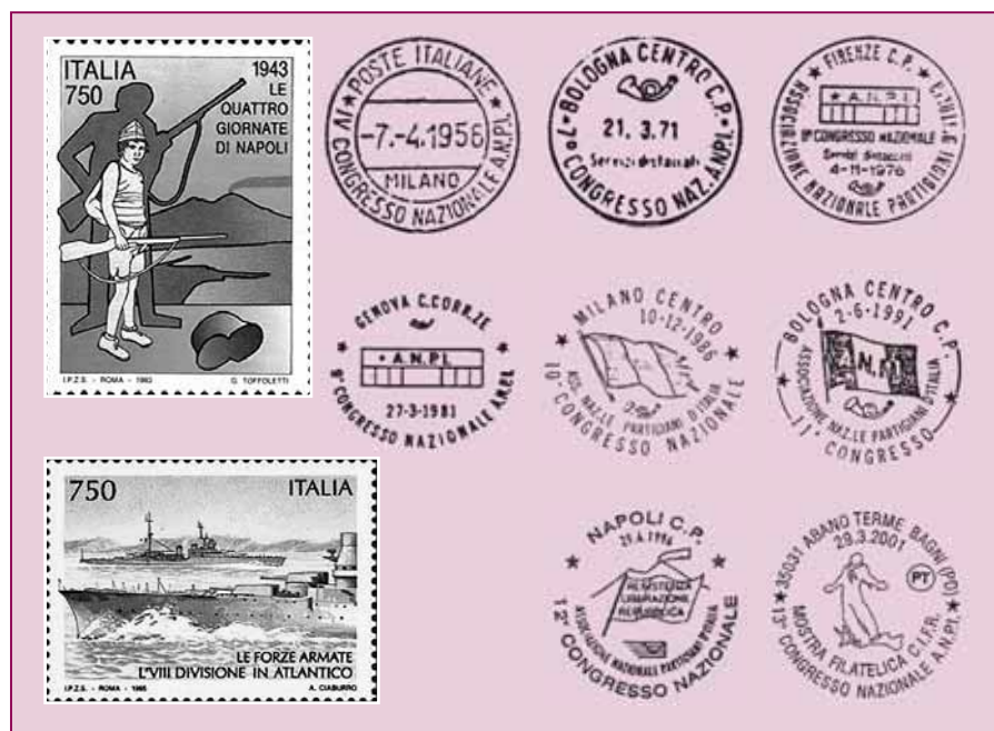
Alcuni annulli e bolli per i vari Congressi.

Per eventuali informazioni i lettori possono rivolgersi al CIFR, Via Vetta d'Italia 3, 20144 Milano.