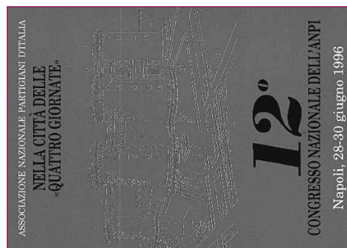
Cartolina del Congresso di Napoli del 1996.