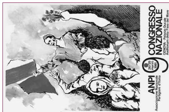
Cartolina celebrativa del Congresso di Genova del 1981.