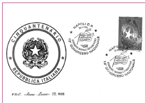
Annullo di Napoli per il 12° Congresso del 1996.

dare saluti a casa o raccogliere l'annullo speciale che in quell'occasione raffigurava il distintivo dell'ANPI. Soggetto sostanzialmente analogo anche per l'annullo del 1981 con una cartolina che riprendeva il manifesto del Congresso riprodotto una litografia di Enzo Sozzo e Sozzo junior. Il Congresso del 1986, che ha visto il CIFR curare l'Ufficio Filatelico del Congresso, ha prodotto una messe di materiale notevole. A fianco della cartolina ufficiale curata da Sozzo junior, il CIFR propose una cartolina disegnata dall'artista imolese Celso Anderlini, raffigurante il tricolore nazionale con le scritte "Resistenza" e "Repubblica" e una cartolina postale numerata con cui si dava il benvenuto ai congressisti; il CIFR propose anche due foglietti erinofili dedicati ai "Martiri milanesi insigniti di Medaglia d'oro al V.M. alla Resistenza" con vignette raffiguranti Filippo Beltrami, Gianni Citterio, Leopoldo Gasparotto, Mario Grecchi, Mauro Venegoni, Giancarlo Puecher Passavalli, Sergio Kasman e Mario Greppi. L'annullo del Congresso raffigurava il