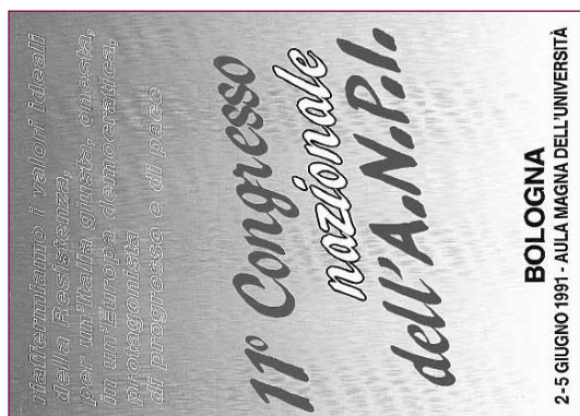
Cartolina celebrativa del Congresso di Bologna del 1991.