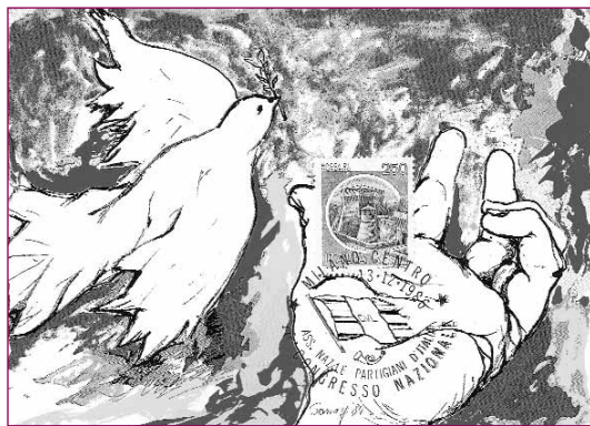
Cartolina celebrativa del Congresso di Milano del 1986.