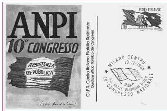
Cartolina illustrata del Congresso di Milano del 1986.