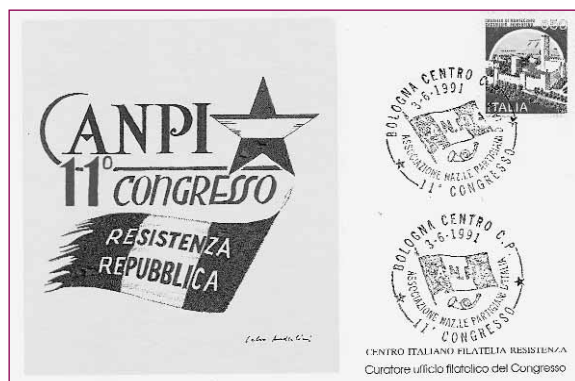
Cartolina del CIFR del Congresso di Bologna del 1991.