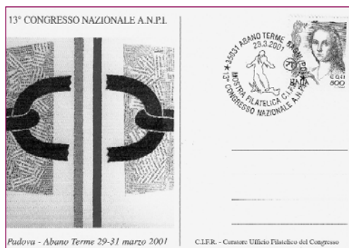
Il CIFR per il Congresso di Padova del 2001.