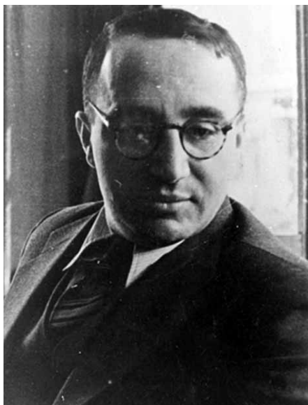
■ Enzo Sereni.