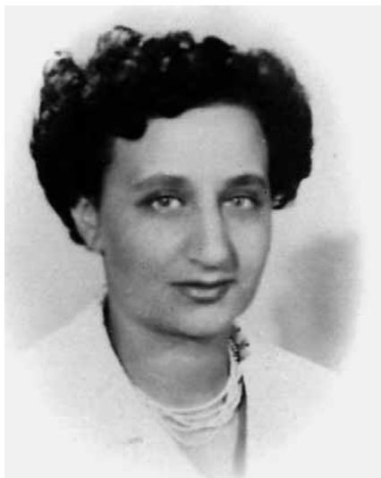
■ Liana Millu.

L'adesione degli ebrei alla Resistenza non fu dettata solo dalla reazione all'antisemitismo nazifascista – che ebbe ovviamente una parte importante nella loro lotta – ma, come per gli altri partigiani, si fondò anche su motivazioni politico-ideologiche e sull'avversione più in generale verso un regime dittatoriale che soffocava la libertà, come testimoniano le lettere pubblicate nel libro scritto da me e Marco Palmieri Gli ebrei sotto la persecuzione in Italia (Einaudi 2011). «E quando viene la tristezza ed il peso diviene duro a portare, bisogna dire: Vita! Vita! e tirare avanti con serenità e coraggio, – afferma Eugenio Curiel in una lettera alla famiglia – ringraziando che tutto il tumulto non riesca a spezzare la nostra fiducia nelle cose fondamentali della vita, ma anzi ci tempri a sperare e a volere cose migliori e una vita più ricca». «W L'Italia Libera», scrive nel suo dia-