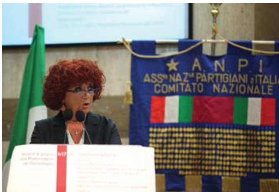
La Vice Presidente del Senato, Valeria Fedeli, durante il suo intervento, alla cerimonia di apertura del 70°

Ci siamo resi conto che la presenza di partigiani, patrioti, militari, combattenti per la libertà, reduci, deportati, nelle nostre file non sarebbe durata all'infinito. La perdita continua di compagni e compagne amati e conosciuti ci ha fatto sentire la necessità di utilizzare meglio le energie residue, per tramandare, per quanto possibile, le vicende storiche e in particolare, la Resistenza; per altro verso, ci siamo dovuti convincere che l'ANPI, pensata prima ancora che finisse la Guerra di Liberazione, non poteva restare ancorata alle concezioni ed al tipo di im-