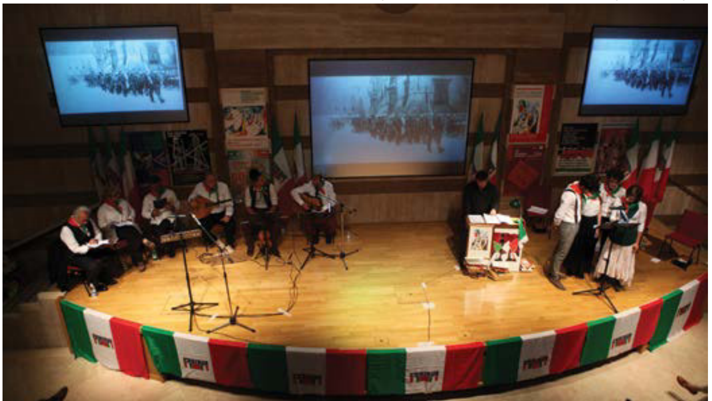
Un momento dello spettacolo “La storia dell’ANPI nella storia d’Italia”

Ma la realtà è questa; e se abbiamo prodotto, nell’ultimo mese, quattro documenti (sulla necessità di riforma della politica, sulle elezioni europee e su quelle amministrative e sulla riforma del Senato) è il segno che voglia-