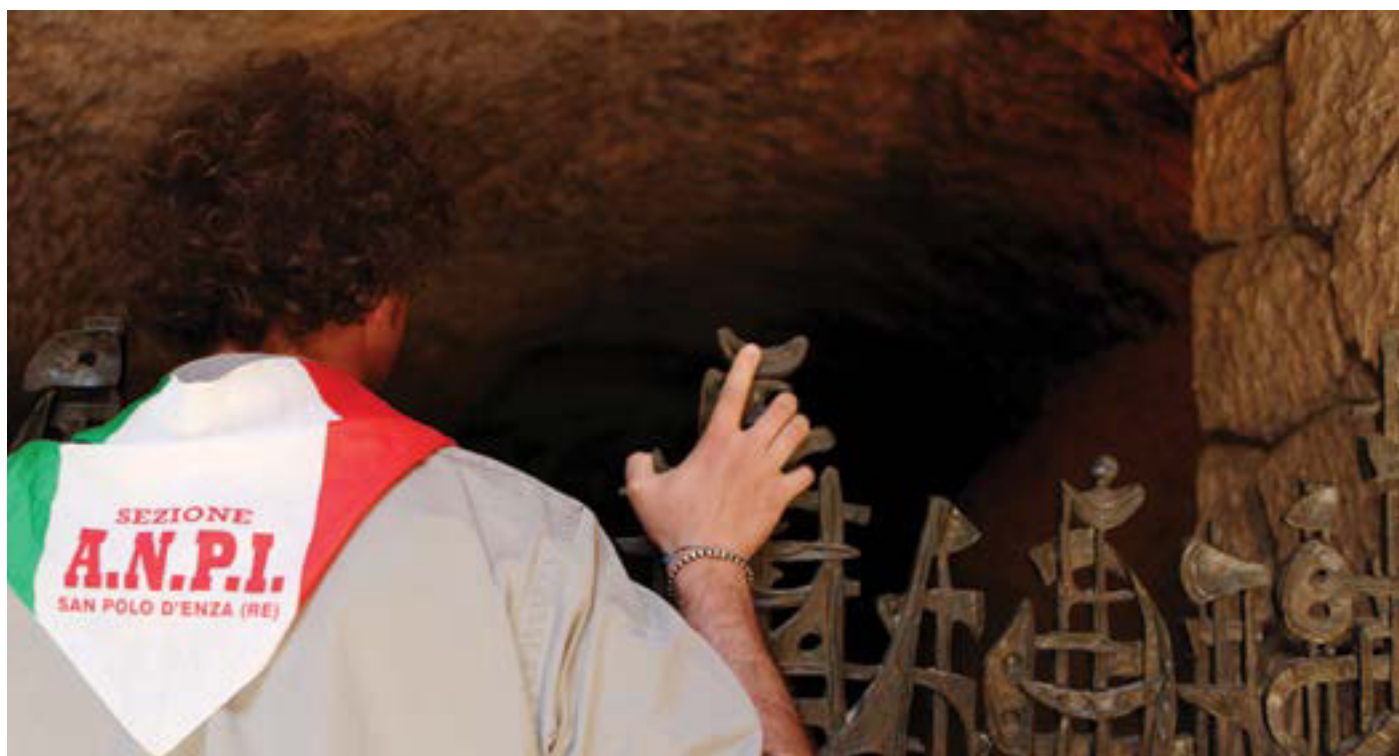
Un giovane della sezione di San Polo d'Enza (RE) all'interno delle Fosse Ardeatine

Anche in questo ambito, non credo che l'ANPI abbia nulla da rimproverarsi; abbiamo fatto la nostra parte nel referendum vittorioso del 2006, ci siamo battuti contro il progetto di modifica perfino dell'art. 138 della Costituzione ed ora siamo impegnati nello sforzo di garantire che la differenziazione del lavoro delle due Camere, ormai necessaria, non si risolva in un sostanziale e pericoloso