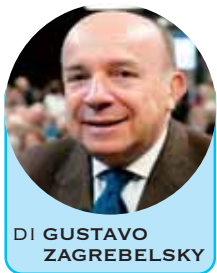
DI GUSTAVO ZAGREBELSKY

Dal discorso di Gustavo Zagrebelsky a Torino il 25 aprile 2015