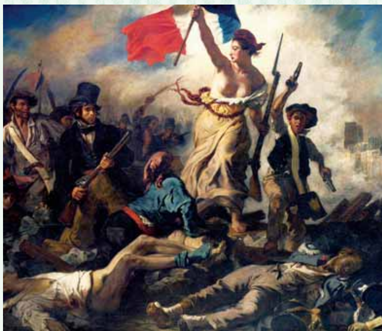
“La libertà che guida il popolo”, dipinto di Eugène Delacroix (1830)

[...] Questa uguaglianza, si dice, è una chimera della teoria che non può esistere in pratica. Ma se l’abuso è inevitabile, è proprio necessario che non si debba almeno cercare di regolarlo? È precisamente perché la forza delle cose tende sempre a distruggere l’uguaglianza, che la forza della legislazione deve sempre tendere a mantenerla”.