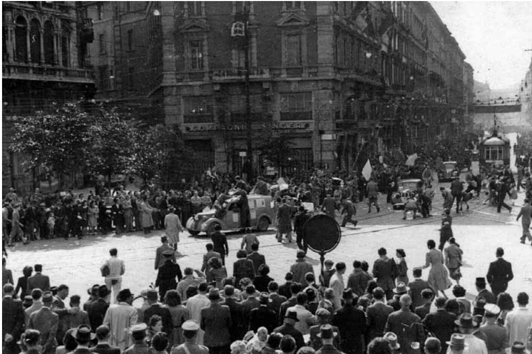
Milano nei giorni della Liberazione

i partigiani e con la Resistenza, cioè con quelli che i proclami della Wehrmacht chiamavano banditi, “Banditen”, si scontrava in non pochi con un senso del dovere nei confronti d’un concetto, sia pure corrotto, di Patria. Non si trattava soltanto d’adesione a ideologie funeste o di timore per le ritorsioni e per la possibile deportazione nei campi di lavoro in Germania. Per questo, ancora una volta, sospendiamo il giudizio.