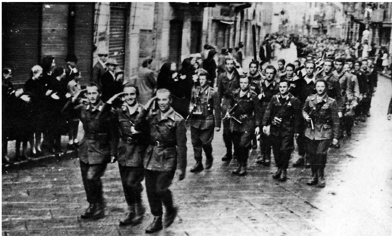
1° comando Zona Biellese - 109ª Brigata - XII Divisione

Così ragionando, si finisce per considerare il fascismo, l'alleanza con la Germania nazista come una semplice parentesi nella nostra storia, e così pure l'antifascismo, che ne sarebbe stata la reazione senza autentiche e profonde radici nel nostro costume: l'uno e l'altra vicende da racchiudere in una memoria che dimentichi l'asprezza del conflitto valorizzando chi non stava né dall'una né dall'altra parte, la zona grigia accomodante. Il popolo italiano rifugge dagli estremismi, dice questa forma di memoria che si vorrebbe condivisa: nel peccato di estremismo sarebbero caduti tanto i fascisti quanto gli antifascisti.